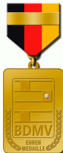
Ehrenmedaille in gold mit Diamant und Jahreszahl am Band mit Urkunde für 25-jährige Tätigkeit und alle weiteren 5 Jahre