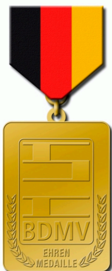
Ehrenmedaille in gold am Band mit Urkunde für 20-jährige Tätigkeit

Antragsteller: Bezirks- / Landesverband Antragsentscheidung: Geschäftsführendes Präsidium Kostenträger: Antragsteller