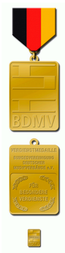
Verdienstmedaille in gold am Band mit Urkunde für 20-jährige Tätigkeit

Antragsteller: Bezirks- / Landesverband Antragsentscheidung: Geschäftsführendes Präsidium Kostenträger: Antragsteller